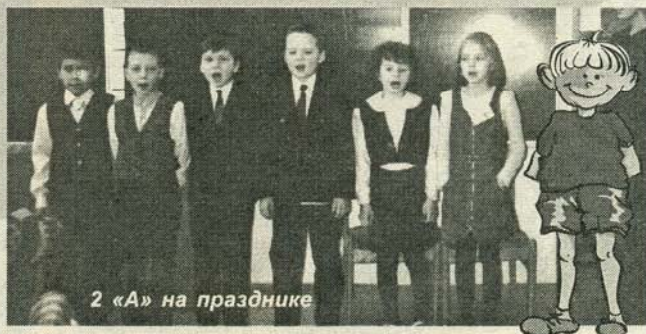
2 «А» на празднике