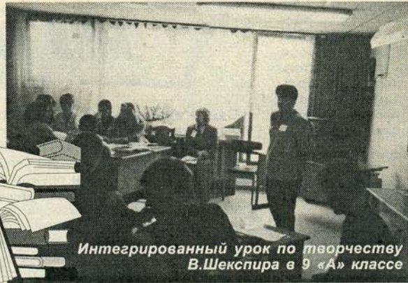
Интегрированный урок по творчеству В.Шекспира в 9 «А» классе

Лицей в моей жизни: Лицей в моей жизни на данный момент занимает главное место, т.к. для меня сейчас важно закончить школу и потом поступить в ВУЗ. А образование в наше время нужно обязательно иметь высшее. Мне нравится наш лицей.