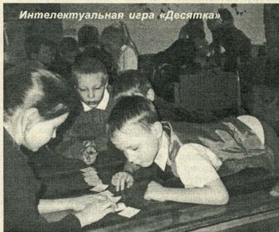
Интеллектуальная игра «Десятка»