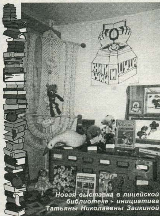
Новая выставка в лицейской библиотеке - инициатива Татьяны Николаевны Заикиной