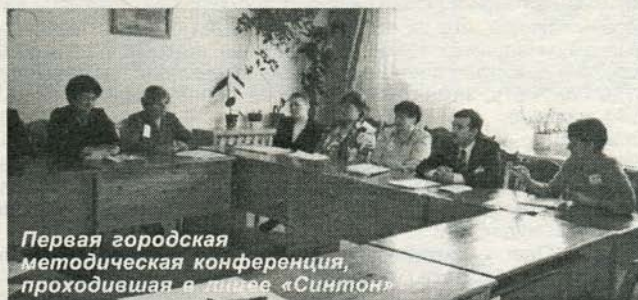
Первая городская методическая конференция, проходившая в лицее «Синтон»