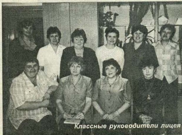
Классные руководители лицея